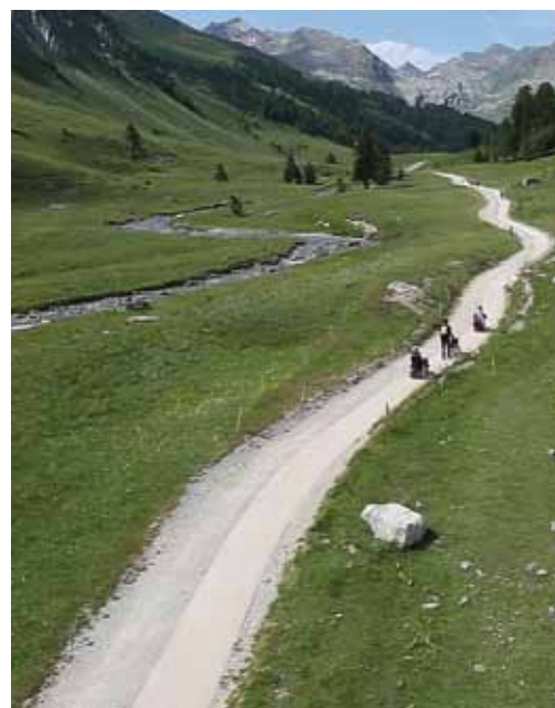
Sentier aménagé dans le vallon du Lauzanier - PNM - Crédit : Atomic Production pour PNF

Pour voir le clip sur le sentier rendez-vous sur www.parcsnationaux.fr , rubrique découvrir - visiter - partager.