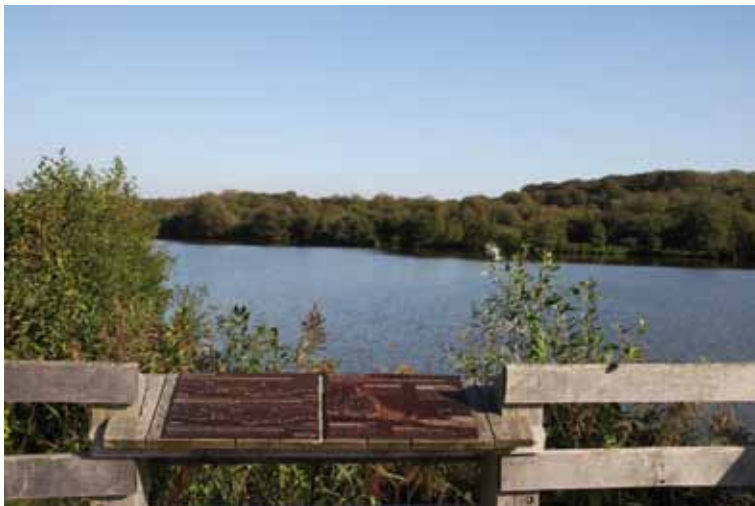
RN Marais de Condette

Information et interprétation ne sont pas sœurs jumelles : les contenus, les objectifs et surtout les méthodologies employées ne sont pas les mêmes.