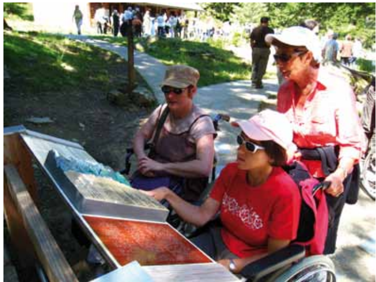
Visite du PNP