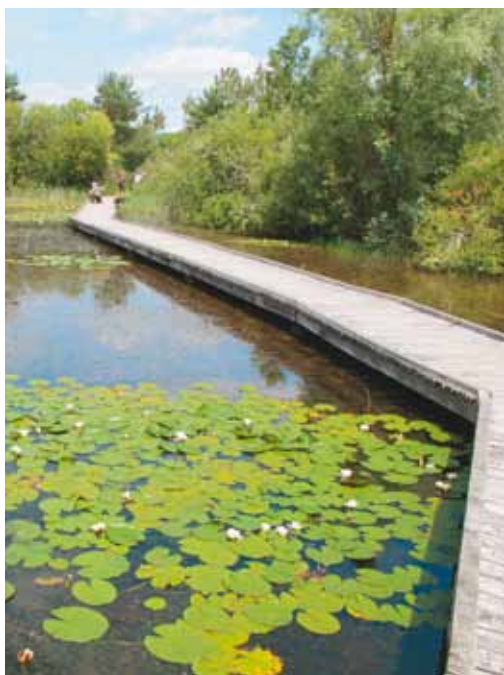
Cheminement sur la mare