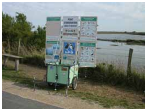
Charlotte la roulotte

Sources : Eco-conception des outils pédagogiques, les livrets de l'Ifree n°1, mars 2010 Les cahiers techniques de la Bergerie nationale, Education à l'environnement et handicap, Réaliser son diagnostic pour réussir l'accueil en ferme pédagogique et les autres structures.