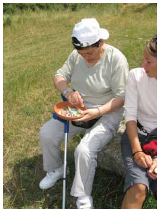
Animation pour un groupe polyhandicapé

Au cours de cette balade qui dure 3 heures (dont une heure de marche et deux heures d'animation), c'est particulièrement la découverte concrète et tactile qui est développée. Les animateurs et les éducateurs spécialisés qui accompagnent le groupe font aussi appel à la créativité par des activités artistiques, et à la sensibilité esthétique avec la collecte d'éléments naturels. Cette activité permet aussi de s'imprégner de la puissance de la nature par la relaxation et la visualisation d'éléments du milieu naturel.