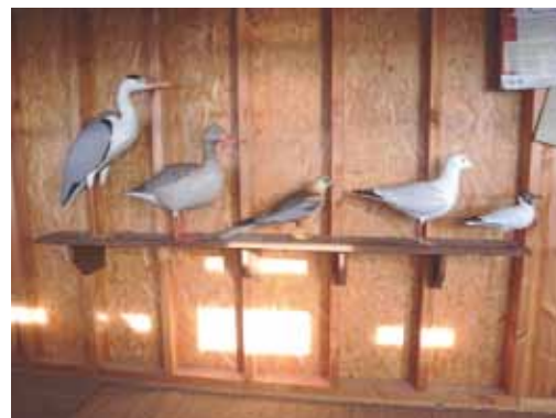
Les maquettes d'oiseaux

Cette initiative va dans le sens de la charte de l'animation des Réserves naturelles de France, notamment pour utiliser une pédagogie active et diversifier les approches (naturaliste, ludique, artistique, sensorielle...) et les démarches de découverte, en privilégiant les sorties sur le terrain. « Il vaut mieux utiliser des représentations plutôt que des oiseaux empaillés » commente le gestionnaire du site.