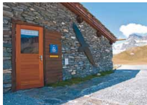
Exterieur du gîte

Pour voir le clip sur le refuge rendez-vous sur www.parcnationaux.fr , rubrique découvrir - visiter - partager.