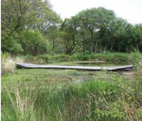
Lan Bern mare pédagogique