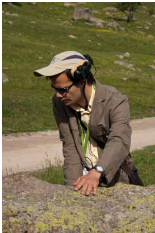
Déficient visuel sur le sentier du Lauzanier