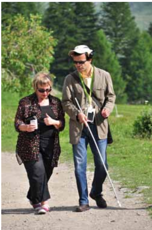
Déficient visuel sur le sentier du Lauzanier - PNM Crédit : Patrick Desgraupes

La loi n° 2005-102 du 11 février 2005 pour l'égalité des droits et des chances, la participation et la citoyenneté des personnes handicapées, a posé le principe d'égalité entre toutes les personnes et l'accès, dans la plus grande autonomie possible, entre autres aux vacances, au tourisme et aux pratiques éducatives, culturelles, sportives et de loisirs.