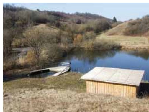
Pendant et après les travaux