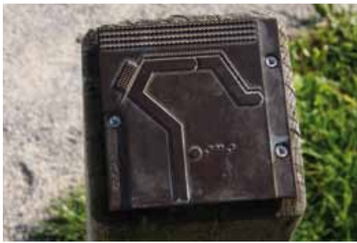
Plaque directionnelle en laiton

Quand le gestionnaire a aménagé le site pour pouvoir accueillir des personnes en situation de handicap, il a également conçu une signalétique directionnelle qui convient à tous les publics, y compris au handicap visuel ou mental.