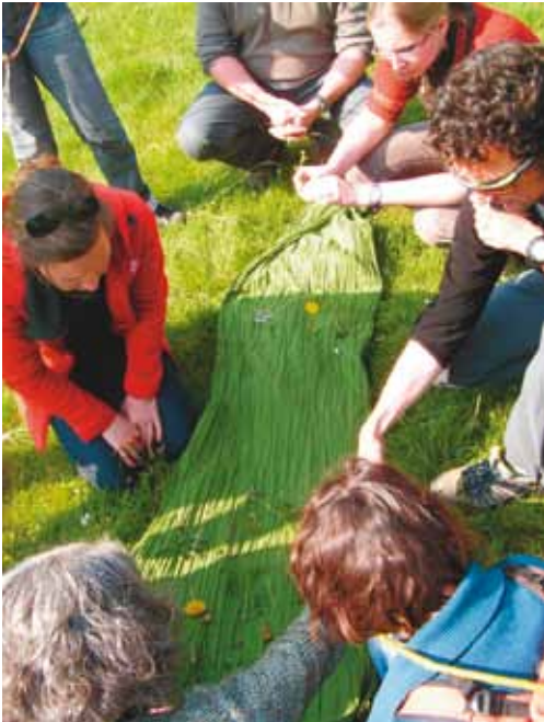
Une animation proposée en fin de stage

« L'essentiel, c'est la personne que l'on a en face de nous et cette notion d'éducation, de l'aider à s'épanouir, à grandir, à aller voir ailleurs. (...) Osons, d'autant plus que ce sont souvent des publics surprotégés. Il y a alors encore plus de bonheur à leur offrir quelque chose qu'ils connaissent finalement peu : le dehors. »