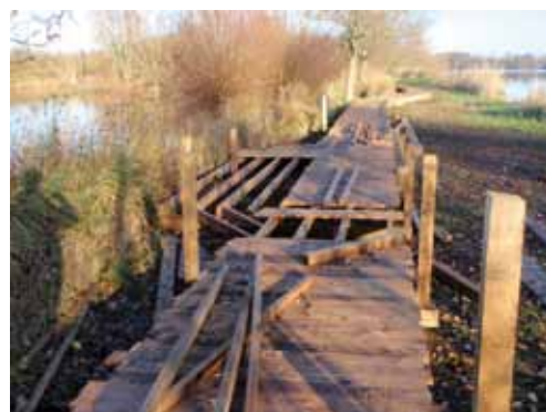
Travaux de rénovation du platelage par un chantier d'insertion

La nouvelle population qui fréquente aujourd'hui le Romelaëre verrait d'un mauvais œil un retour en arrière mais prenons garde à ne pas aller vers une fuite en avant, et oublier ce qu'était le Romelaëre avant 1999. J'ai aujourd'hui l'impression de voir du Romelaëre un peu partout ; les platelages poussent comme des champignons dans de nombreux sites naturels, ce qui tend à une banalisation des cheminements en sites naturels. Les animateurs nature sont peut-être en mesure d'apporter une réponse dans la minimisation des aménagements. Ils sont capables d'emmener des personnes différentes sur des sentiers plus difficilement accessibles. Même si les personnes en situation de handicap physique sont certainement celles qui ont le plus besoin de sentiers adaptés, on peut leur imaginer une nouvelle approche. En réduisant les coûts des équipements, on pourrait transférer une partie de l'investissement vers des outils adaptés comme la Joëlette*, l'hippomobile*, la randoline*....que l'animateur nature pourrait utiliser. L'effort vaut le coût car l'accès à la nature par l'éducation doit se faire pour tous. Mais il ne faut pas oublier que l'accessibilité, ce n'est pas tout ou rien, et que bien connaître la population utilisant le site est la clé d'un aménagement raisonné.