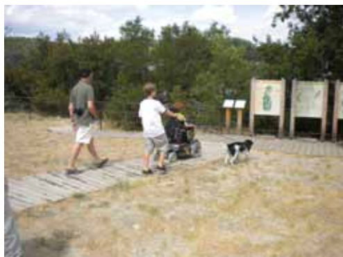
Gorges d'Oppedette

Aménager un site naturel pour le rendre accessible implique la double contrainte de domestiquer la nature tout en la respectant. Inscrire la réalisation d'aménagements dans une démarche éco-responsable amène à trouver souvent des solutions techniques qui riment avec innovation.