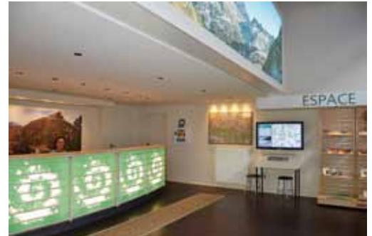
Espace d'accueil de la maison du PN à Cauterets

Pour voir le clip sur la maison du PN à Cauterets rendez-vous sur www.parcsnationaux.fr , rubrique découvrir - visiter - partager.