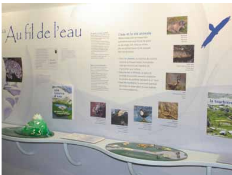
Maison du Plan d'Aste - PNP