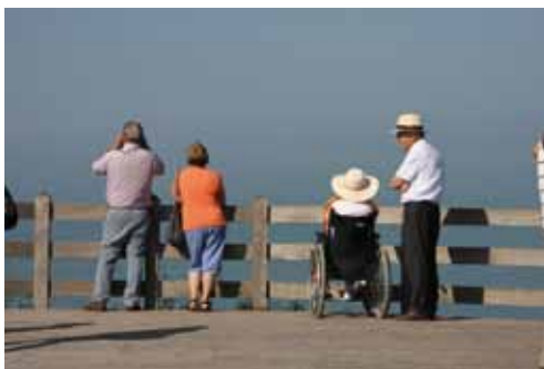
Cap Blanc Nez