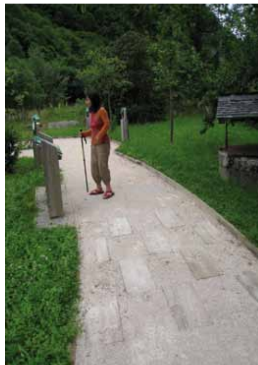
Signalétique sur le sentier des arbres

Le sentier, entièrement créé, s'inscrit dans un ensemble dont il a fallu penser globalement l'accessibilité. Le parking a été réaménagé ainsi que les toilettes. Une aire de pique-nique avec des tables adaptées sont également accessibles aux personnes en situation de handicap.