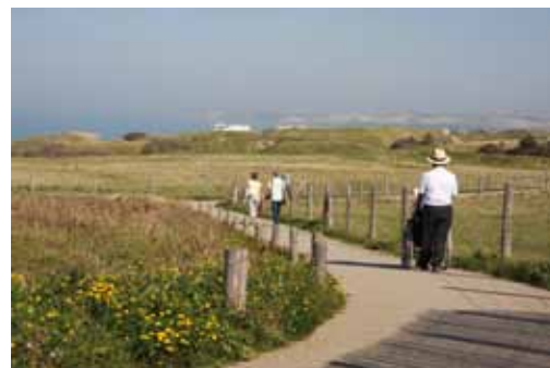
Grand site de France des Deux-Caps Blanc-Nez, Gris-Nez

Enfin, ne pas négliger l'entretien du cheminement. Orties, ronces ou simples plaques d'herbes rendent rapidement le trajet compliqué aux personnes en situation de handicap. L'automne et ses feuilles mortes sont aussi un élément à prendre en compte dans le planning d'entretien.