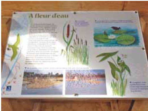
Panneau d'aide à l'observation en braille