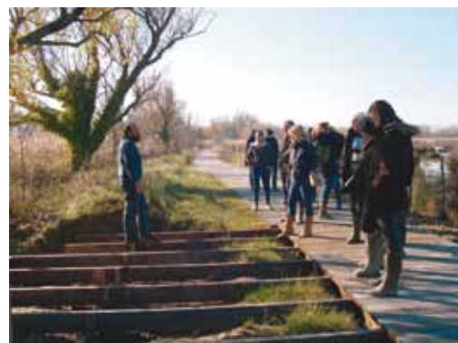
Visite pour le réaménagement du site

En 2003, l'association les Amis des Marais du Vigueirat a adhéré à la démarche « nature et handicap » portée par la Ligue pour la protection des oiseaux de la région Paca.