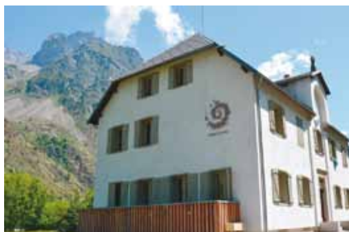
Maison du Parc national en Valgaudemar

Comment faire partager aux personnes en situation de handicap les merveilles que recèlent les espaces naturels protégés ? Comment aider les mal-voyants à reconnaître les différentes espèces d'oiseaux ? Les réponses passent par des réaménagements de maisons de sites souvent ambitieux avec la difficulté de préserver des bâtiments classés, d'aménager l'intérieur sans toucher à l'extérieur, de limiter la consommation énergétique de l'établissement tout en modernisant les installations. Quelle est la clé du succès d'une fréquentation accrue ? Comment associer au projet les partenaires techniques et scientifiques, les associations de personnes en situation de handicap ? Quelle est la place de la formation du personnel dans cette démarche ?