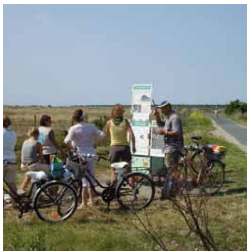
Charlotte près de la piste cyclable