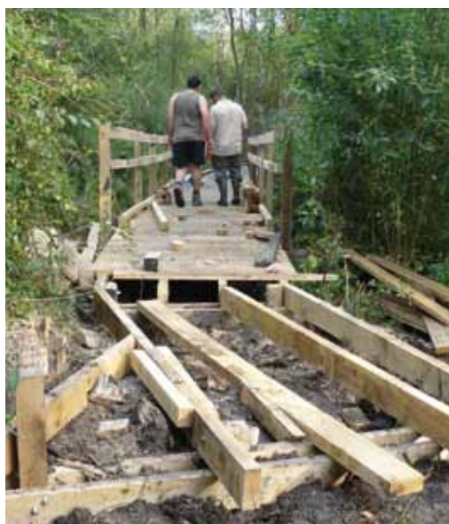
Travaux réalisés par un chantier d'insertion