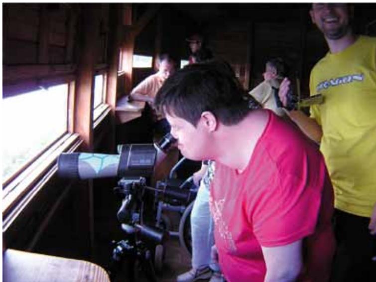
Animation d'observation dans la réserve de Chérine

Les observatoires, ou belvédères, sont prévus pour permettre aux visiteurs, quel que soit leur handicap, de profiter d'un panorama, d'un point de vue, d'une position favorable à l'observation d'espèces. Ils nécessitent une zone de retournement sans obstacle de 1,5 m de diamètre et un garde-corps d'environ 1 m pour ménager une zone de vision entre 60 et 110 cm. Pour les observatoires derrière une palissade ou dans une cabane aménagée, prévoir des ouvertures à différentes hauteurs (au moins une à 90 cm), et ménager un accès permettant l'avancée d'un fauteuil. Penser également à des supports pour poser les jumelles pendant l'observation.