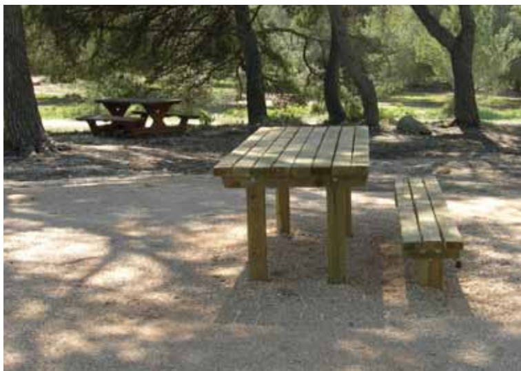
Forêt de Meudon, table adaptée - Crédit : Elsa André – ONF

Selon la réglementation, les zones de stationnement réservées doivent être signalées par une signalisation verticale et un marquage au sol. Mais dans un espace naturel, il est parfois difficile de faire ce marquage, surtout si on veut éviter de traiter toute la surface du stationnement. On peut cependant considérer que la répression des contrevenants n'est pas essentielle, le pouvoir de police n'est parfois pas réellement appliqué dans ce domaine. Par ailleurs la pression de stationnement n'est peut-être pas très importante. Dans ce cas une signalisation verticale peut suffire.