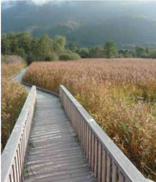
Platelage au sud du lac