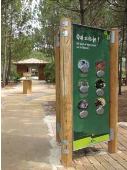
Plage du Petit Nice