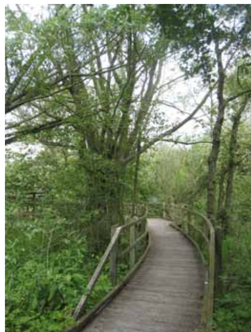
Marais de Cambrin

Le tracé, outre les contraintes techniques, doit permettre au visiteur de se faire une idée des différents milieux du site. Bien positionné, il permettra de tranquilliser la zone en le contenant en périphérie.