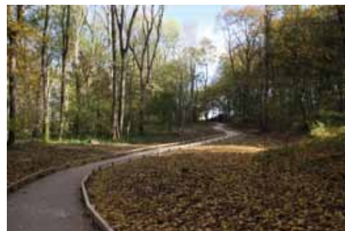
Cheminement du Bois de Marœuil

Lorsque les contraintes techniques ou environnementales l'imposent, il est possible de réduire ponctuellement le cheminement à 90 cm avec des zones de croisement élargies. Dans ce cas, il est indispensable que l'on puisse voir une personne arrivant en sens inverse avant de s'engager sur la portion de chemin. Le cheminement est constitué d'un géotextile, d'un soubassement en « tout venant » 0/36 sur une épaisseur de 25 cm recouvert par 5 cm de sable de Marquise mélangé au liant. Il a été complété par un fil d'Ariane en chêne ainsi que par des bandes de guidage au niveau des croisements afin de le rendre accessible aux personnes mal-voyantes.