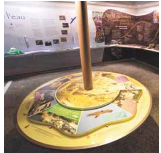
Maison du plan d'Aste

Porter également une attention particulière à la qualité de l'éclairage.