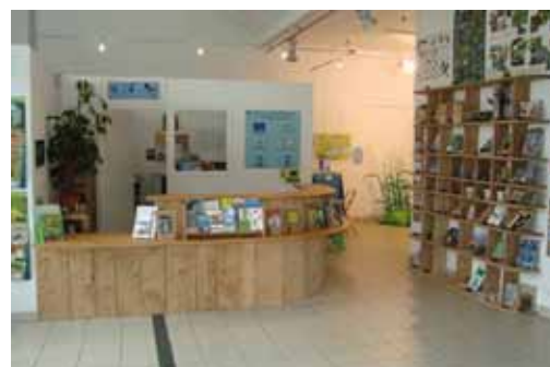
Accueil de l'espace nature

Nul doute que la prochaine exposition, spécialement conçue pour être accessible aux personnes en situation de handicap (son, toucher, visuel et expérience...), permettra de relancer la communication vers ce public et d'augmenter la fréquentation.