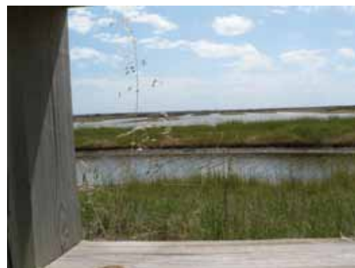
Vue sur la réserve de Moëze-Oléron

Aujourd'hui, cet aménagement porté par la communauté de communes Sud Charentes permet d'intégrer l'espace protégé dans un développement économique local basé sur l'éco-tourisme, et d'accueillir les 20 000 visiteurs annuels dans de bonnes conditions. L'accueil et l'animation confortent la mission de gestion de la réserve naturelle.