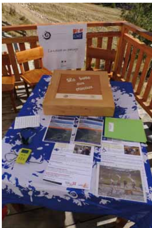
Ensemble des outils proposés par le PN Vanoise à destination des personnes en situation de handicap

NB : les partenaires des projets cités ne sont pas tous détaillés, vous en retrouvez une liste plus exhaustive sur le site du cahier technique ct85.espaces-naturels.fr .