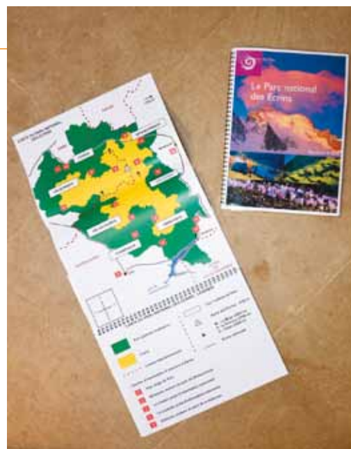
Brochure du Parc national des Écrins

L'Association Alpes Regards 05 a largement contribué à l'élaboration de ce document. A la grande satisfaction des non-voyants : « quand on arrive ici, on a l'impression d'être accueillis, qu'on a fait beaucoup d'efforts pour nous faire imaginer ce qu'est le parc des Écrins et c'est très important ».