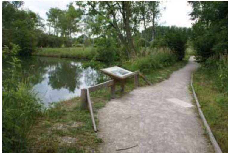
RN de l'Étang Saint-Ladre

Pour se déplacer au sein de l'espace naturel sans rupture de la chaîne de déplacement, les personnes déficientes visuelles ont besoin de se sentir en confiance dans un nouvel environnement dans lequel elles évoluent. Or, lorsqu'une personne est en visite, elle ne connaît pas forcément la configuration du lieu où elle se rend.