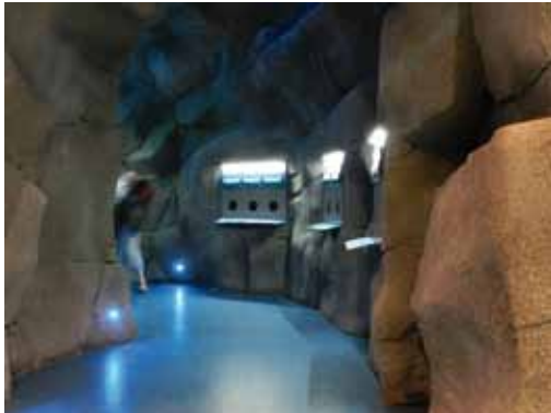
Une muséographie revue, modernisée et accessible