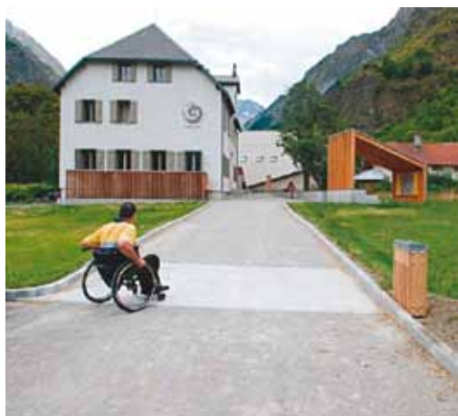
Maison du Parc national