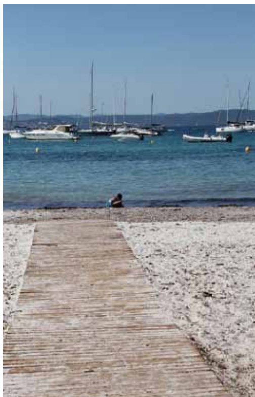
Le platelage amovible de la plage d'Argent