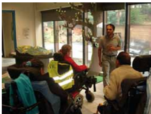
Animation avec un garde