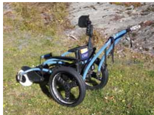
Fauteuil hippocampe

Pour les personnes à mobilité réduite, tous les refuges-portes et certains sites vont être progressivement équipés des fauteuils tout chemin, qu'on appelle aussi « fauteuils hippocampe* ». Dotés de deux roues à l'arrière, ils sont prolongés par une seule roue à l'avant. Ces véhicules sont indispensables pour suivre certaines animations. Il est maintenant possible pour une personne se déplaçant en fauteuil d'observer les marmottes ou d'effectuer des randonnées au cœur du Parc.