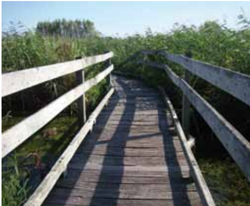
Platelage ancien

Billet de Sébastien Ansel, Eden 62, animateur nature