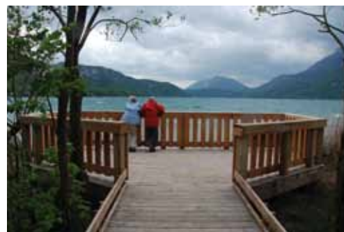
RN Bout du lac d'Annecy