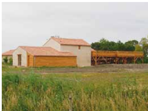
Maison de la réserve