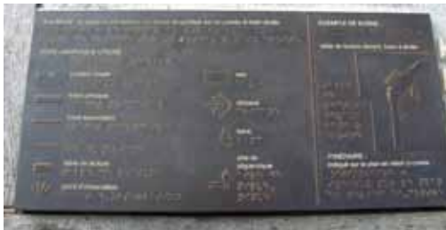
Mode d'emploi de la signalétique pour les personnes déficientes visuelles