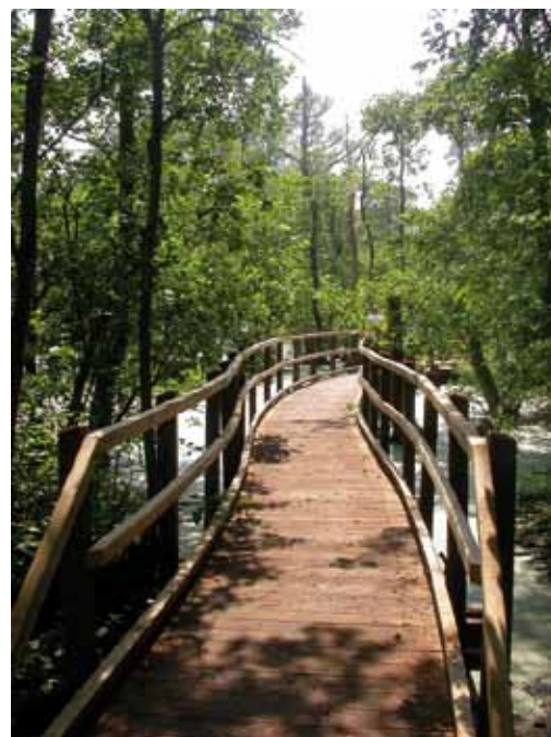
Grande passerelle du marais de Cambrin

Le site est dorénavant fréquenté par les habitants des environs, sans que la population ne le considère réellement comme un espace protégé, ce qui pose des problèmes d'entretien (déchets, actes malveillants...). D'où la nécessité de bien planifier les entretiens avec les communes propriétaires, car la maintenance est un poste important et nécessaire dans le cadre d'un sentier tous publics (longévité, fonctionnalité...).